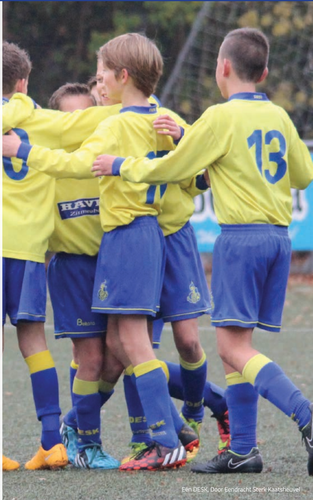
Eén DESK, Door Eendracht Sterk Kaatsheuvel

Een vrijwilliger is een persoon die op vrijwillige basis een bijdrage levert aan de ontwikkeling van de vereniging.